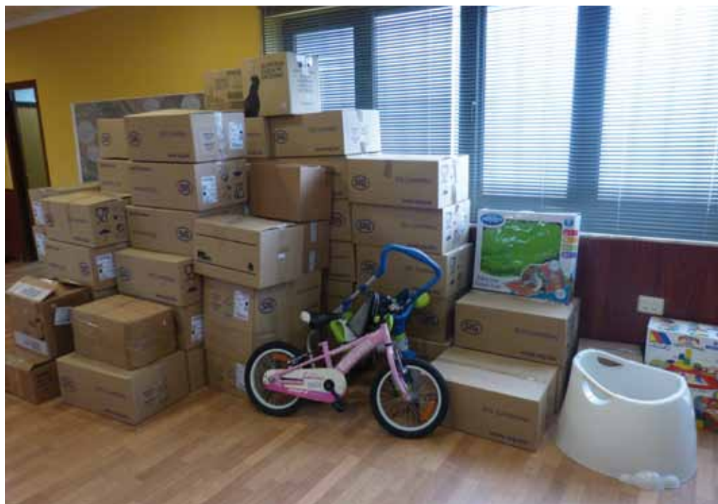
Material donado para los campamentos de refugiados del Sahara

LA GRAN RECOGIDA DE ALIMENTOS 2018: El Ayuntamiento de Coaña colaboró un año más, con la Fundación del Banco de Alimentos de Asturias: se trata de una organización sin ánimo de lucro, completamente gestionada por voluntarios cuyo objetivo primordial es la lucha contra el despilfarro de alimentos y contra el hambre y la malnutrición en nuestra Región. En esta ocasión y gracias a la solidaridad de mu-