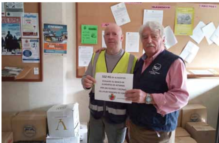
Voluntarios del Banco de Alimentos recogiendo los 502 kilos donados en Coaña

chos vecinos de Coaña, dos voluntarios del Banco de Alimentos recogieron en el Ayuntamiento un total de 502 kilos de alimentos de primera necesidad destinados a favor de familias asturianas en situaciones de dificultad económica.