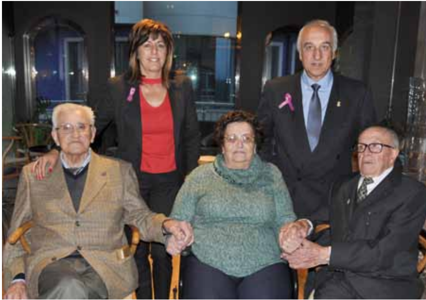
Autoridades y homenajeados en el Día de Mayores 2018

A este presupuesto hay que añadir la importante donación de alimentos que desde el Comité de Empresa de Reny Picot han hecho hasta el pasado año 2017 durante 7 años consecutivos, empresa a la cual desde estas páginas queremos agradecer su inestimable colaboración.