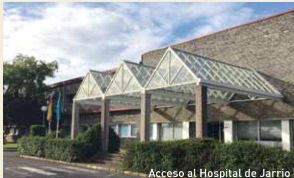
Acceso al Hospital de Jarrío

Sin embargo, desde hace unos años estamos asistiendo a constantes recortes, falta de profesionales de mu-