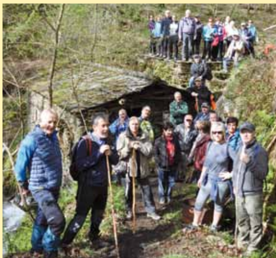
Ruta al Molín de Abredo 2018

domingo 10 de febrero, realizaremos esta ruta, con un trazado de 14,5 kilómetros y baja dificultad. La salida tendrá lugar a las 8 de la mañana de la marquesina del Hospital de Jarrío, debiendo las personas interesadas en