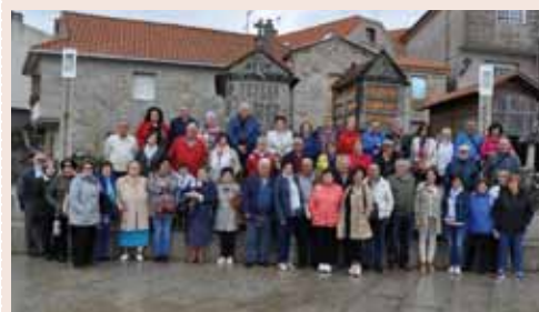
Participantes en el Viaje a Galicia 2018

Las personas interesadas en acudir, han de reservar su plaza antes del 29 de Marzo, dirigiéndose al Área de Animación.