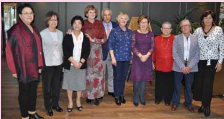
Autoridades y homenajeadas en la pasada edición

Un año más, el sábado 9 de Marzo, Coaña conmemorará el Día Internacional de la Mujer con la realización de un merecido homenaje a todas aquellas mujeres que en el año 2019 alcanzan los