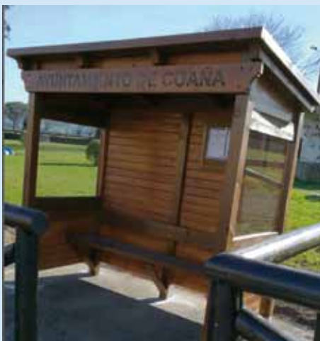
Estado actual de la marquesina

Desde el Ayuntamiento de Coaña continuaremos poniendo todos los medios necesarios para que los Servicios Sociales Municipales sigan siendo el lugar al que toda la población pueda acceder en pro de garantizar su bienestar y tener acceso a que se garanticen sus derechos sociales básicos.