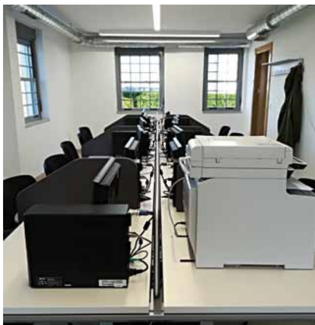
Interior del CDTL

EL CENTRO DE DINAMIZACIÓN TECNOLÓGICA LOCAL ha tenido un gran peso en la eliminación de la brecha digital en el territorio, a través del acercamiento a las Nuevas Tecnologías de diferentes sectores poblacionales, la formación a empresas, el acompañamiento a ciudadanos en sus labores diarias ofimáticas y tecnológicas. Además, el servicio ha dado solidez al Maratón Fotográfico por el Municipio de Coaña, una actividad que fomenta el descubrimiento del municipio, la creatividad y el uso de las nuevas tecnologías. Acoge ahora, además, nuevos retos dirigidos a mejorar las competencias de familias e infancia en un uso responsable, correcto y