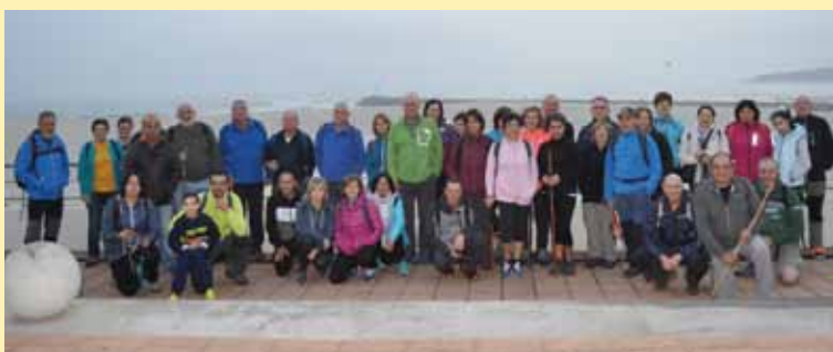
Ruta Foz a Burela 2018

Conmemoraremos este año el Día del Deporte, con la organización de esta ruta de senderismo para toda la familia que nos llevará a recorrer los Lagos de Covadonga. Se trata de una senda circular, de apenas 6 kilómetros que recorre la Mina de la Buferrera, el Lago Ercina, la Laguna Bricial, el Lago Enol y el Mirador de la Princesa, inaugurado hace pocos meses. La salida será el domingo 31 de Marzo, a las 8 de la mañana de la marquesina del Hospital de Jarrío, debiendo las personas interesadas en acudir, formalizar su inscripción antes del 26 de Marzo en el Área de Animación del Ayuntamiento de Coaña. El coste del viaje es de 15 euros para los adultos y gratuito para todos los niños y niñas que acudan, siendo necesario llevar comida.