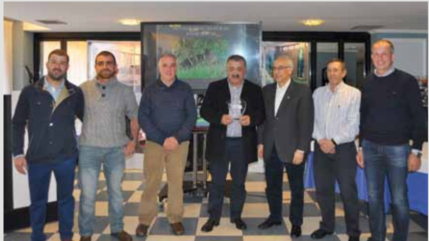
Autoridades con la Junta Directiva de la Sociedad de Cazadores "El Corzo"

El programa de actos previsto, que se desarrollará el sábado 23 de marzo y que dará comienzo a las 13.00 horas en el Restaurante Blanco de La Colorada, tendrá como plato fuerte la entrega de los