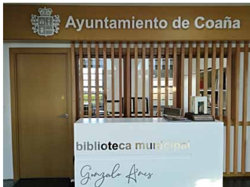
Recepción e interior de la Biblioteca Municipal