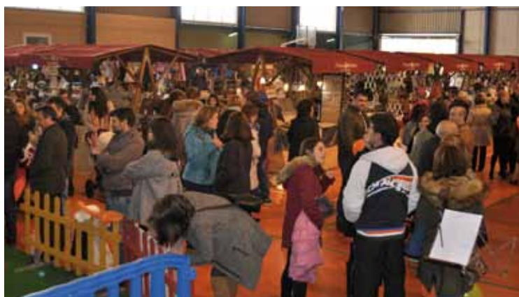
La pasada edición de Agroarte contó con numeroso público