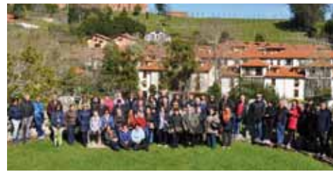
Fin de Semana Lebaniego 2019

De la mano de la concejalía de Bienestar Social del Ayuntamiento de Coaña, llevaremos a cabo entre