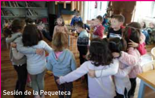
Sesión de la Pequeteca

La cuantía invertida en las actuaciones mencionadas anteriormente en los parques asciende a la cantidad de 68.903,55 euros, de los cuales, el 18% ha sido subvencionado y el 82% procede de las arcas municipales.