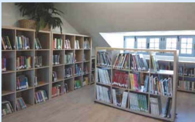
Sala Juvenil en la Biblioteca

Plan SAPLA y 11.163,90 euros son aportados por las arcas municipales.