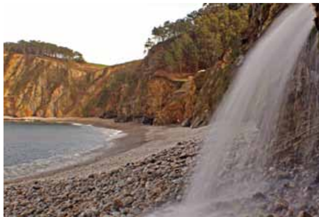
Playa de Torbas

- TORBAS, debido a su menor peligrosidad y afluencia, contará con este servicio exclusivamente los fines de semana y festivos (26 de julio y 15 de agosto), también en horario ininterrumpido de 12.00 a 19.00 horas.