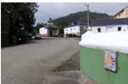
Camino de Santiago en Folgueras

una de nuestras preocupaciones es mantener en las mejores condiciones el Camino de Santiago a su paso por Coaña, y a pesar de que la gestión de dicho recurso pertenece a la Consejería de Educación y Cultura, a través de la Dirección