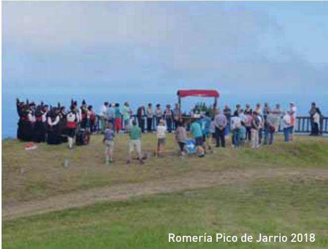
Romería Pico de Jarrío 2018