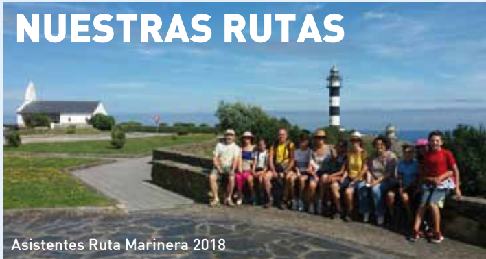
Asistentes Ruta Marinera 2018

Un año más, la Concejalía de Turismo plantea la realización en período estival de dos rutas guiadas y gratuitas destinadas a dar a conocer la belleza cultural y paisajística de nuestro municipio a vecinos, visitantes y turistas que deseen acudir, sin necesidad de inscribirse previamente.