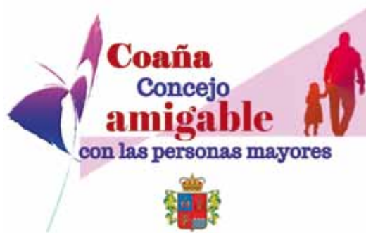
Logotipo del proyecto

La adhesión a la Red implica analizar cómo es nuestro concejo, como mejorarlo y hacer los cambios necesari-