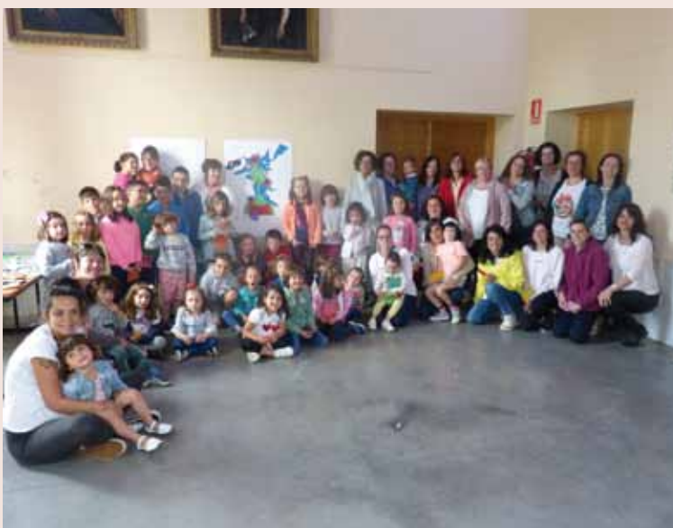
Asistentes al Taller – junio 2019

Coaña apuesta por la igualdad uniendo fuerzas, por lo que el Centro Asesor de la Mujer, Área de Animación Sociocultural, Biblioteca Municipal y Plan de Infancia, se han dado la mano para avanzar en materia de igualdad y para rechazar y prevenir la violencia de género.