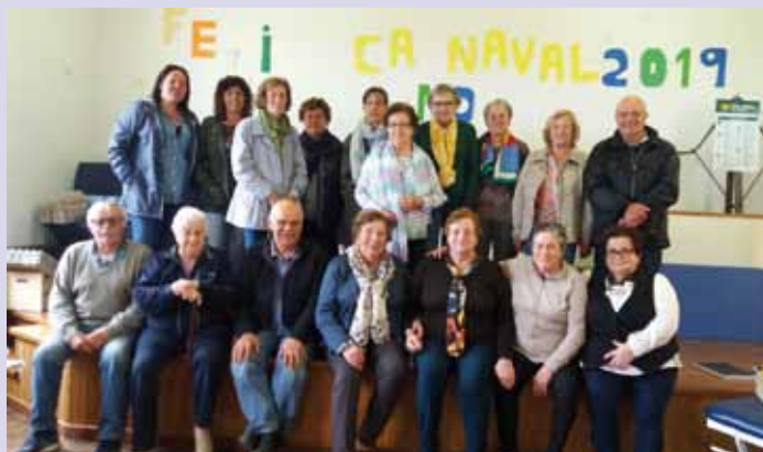
Asistentes Taller de Memoria de Jarrío

Las personas interesadas en participar, deben inscribirse antes del 3 de octubre en el Área de Animación del Ayuntamiento de Coaña, siendo el mismo totalmente gratuito y estando destinado a