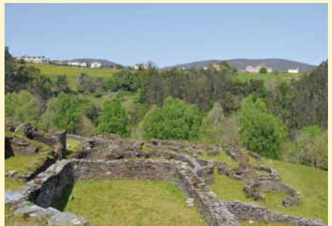
Castro de Coaña

El coste de la entrada al Castro es de 3,13 euros, excepto los miércoles, que el acceso es gratuito.