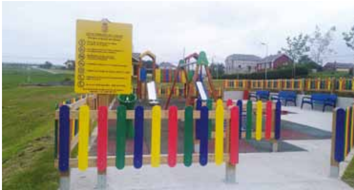
Parque en Coaña

Han sido varias las actuaciones llevadas a cabo en diferentes equipamientos infantiles del Concejo a lo largo de estos últimos meses, continuando de esta forma con la línea de trabajo marcada por el Plan Municipal de Infancia y con el objetivo de cumplir sus objetivos.