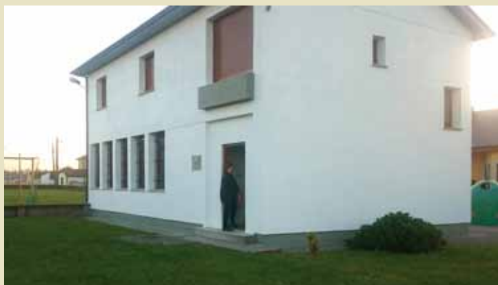
Escuelas de Loza

Es por ello que en próximas fechas se mantendrá una reunión con las directivas de las asociaciones que tienen cedida alguna de las antiguas escuelas, para conocer las necesidades de cada edificio y de esta forma poder realizarse por parte de la Oficina Técnica Municipal una memoria de las actuaciones que se consideren prioritarias.