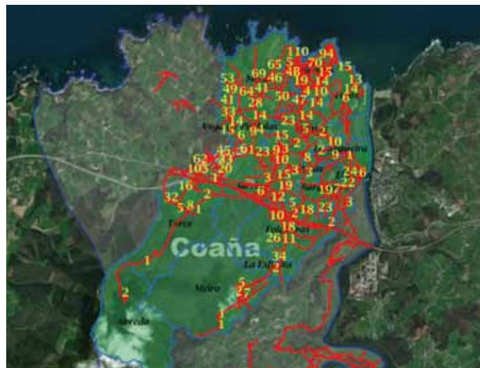
Plano del callejero

Desde el Ayuntamiento de Coaña, se prevé llevar al Pleno Ordinario que se convocará en octubre el Callejero defini-