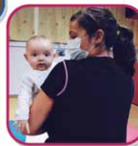
Escuela "La Estela"