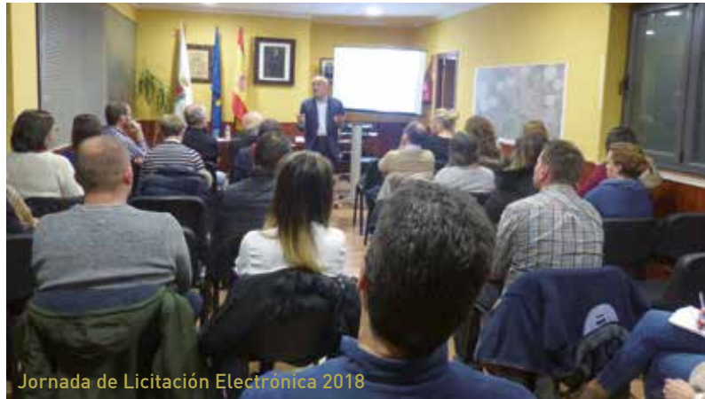
Jornada de Licitación Electrónica 2018

- Inscripción en el Registro Oficial de licitadores y empresas clasificadas del Estado (ROLECE) así como otras herramientas y servicios de obligado cumplimiento desde el 9 de Septiembre de 2018.