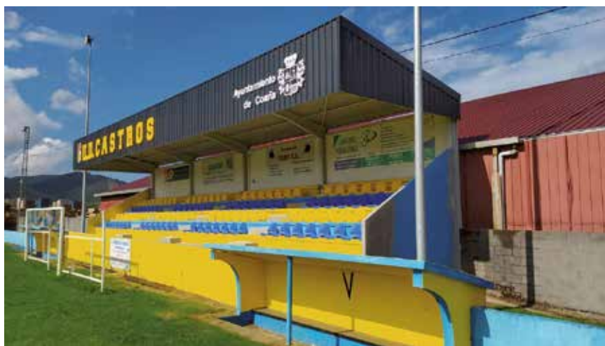
Gradas Campo de fútbol U.D. Los Castros