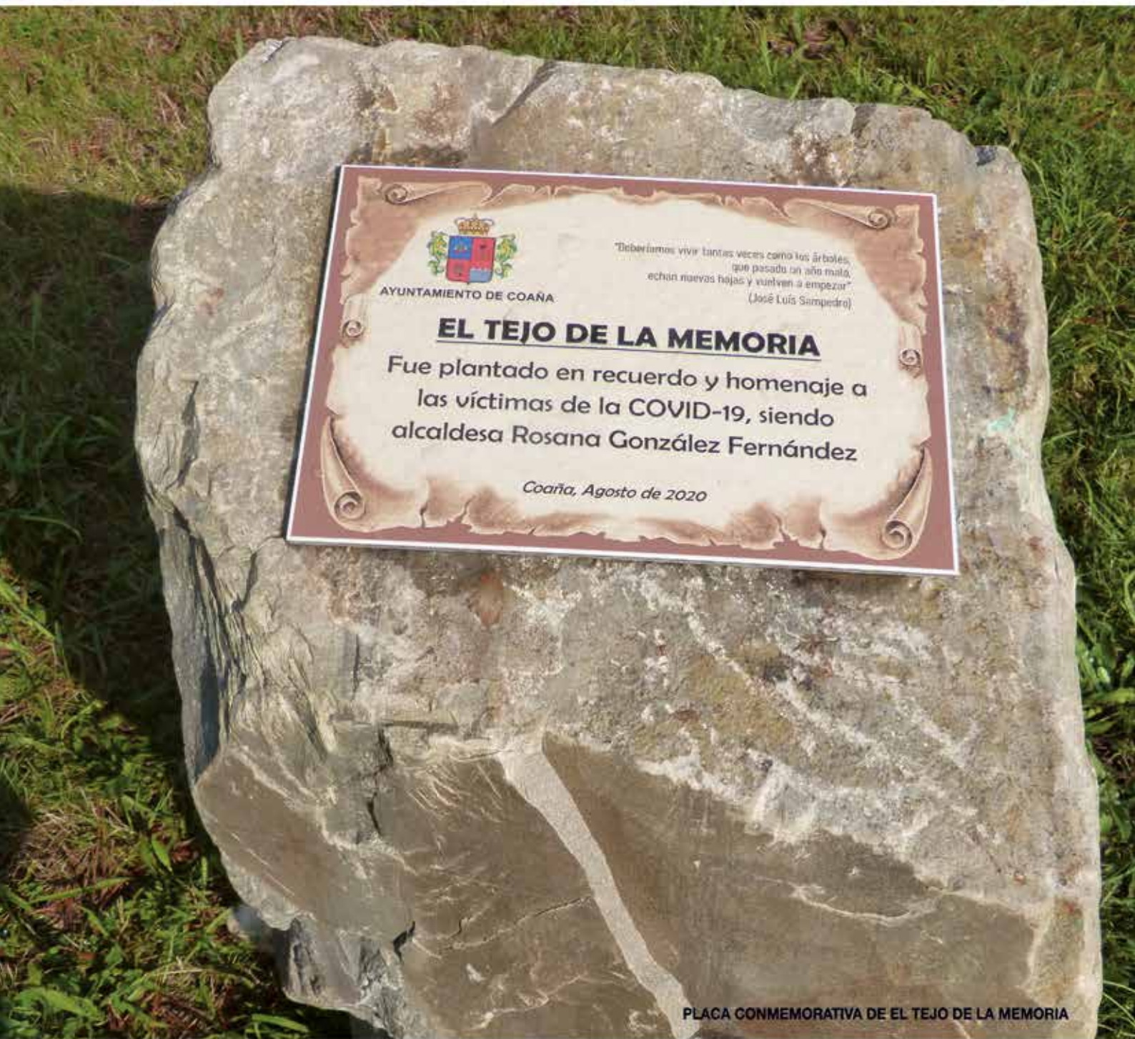
PLACA CONMEMORATIVA DE EL TEJO DE LA MEMORIA

REVISTA DE INFORMACIÓN MUNICIPAL • N° 74 • OCTUBRE 2020