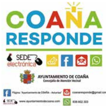
Imagen de “Coaña Responde”

- Vía WhatsApp , el número de peticiones, solicitudes de cita previa, envío de información para derivar a los servicios municipales, etc. es totalmente incuantificable. A diario se reciben por este medio gran número de consultas, habiéndose además creado varios grupos el envío de información que puede resultarles de interés, como Hostelería o Comisiones de Fiestas.