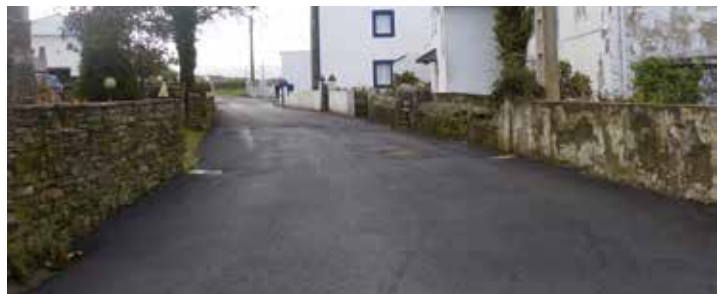
Viales que han sido reformados