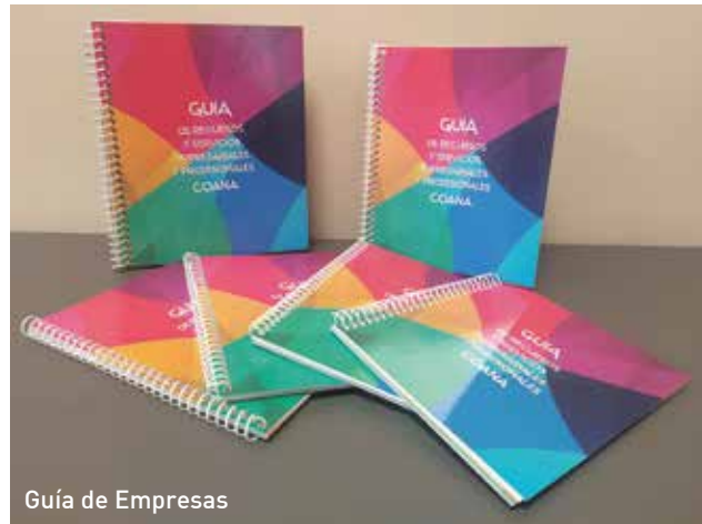
Guía de Empresas

VÍDEOS PROMOCIONALES: elaboración de dos vídeos