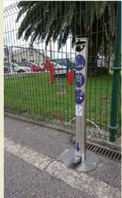
Apostando por la prevención