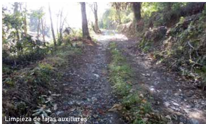
Limpieza de fajas auxiliares

A esto, debe añadirse la limpieza en esta anualidad de las denominadas "fajas auxiliares contra incendios", que fue adjudicada a la Unión de Cooperativas Forestales de Asturias (UCOFA), que llevó a cabo la limpieza de 94,17 kiló-