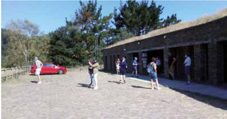
Visitantes al Castro en agosto

Desde la Concejalía de Turismo se coordinó la apertura de la Oficina de Turismo de Coaña, ubicada en las instalaciones del Castro de Coaña, del 1 de julio al 31 de agosto, estableciendo un protocolo de apertura en base a las medidas sanitarias establecidas.