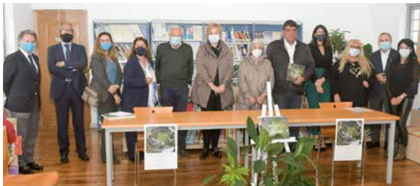
Presentación del libro “Concejo de Coaña”

Con más de 300 imágenes del concejo, esta obra de Ignacio Martínez se convierte en un libro esperado para coañeses, amantes de la fotografía, vecinos y visitantes.