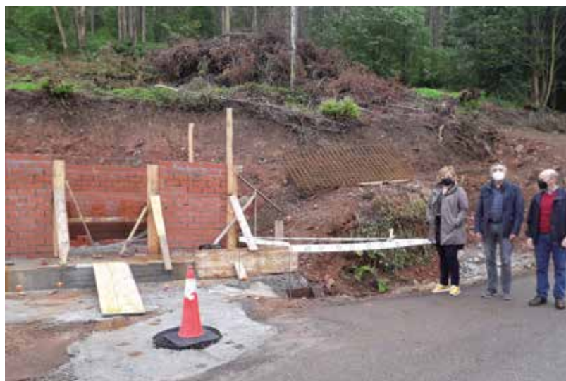
Obras abastecimiento de aguas a Abredo (Folgueras)

En este trimestre se prevé la finalización de estas obras que son una "deuda" con los vecinos de este pueblo que, aun teniendo este hándicap, cuenta con una empresa de reconocido prestigio.