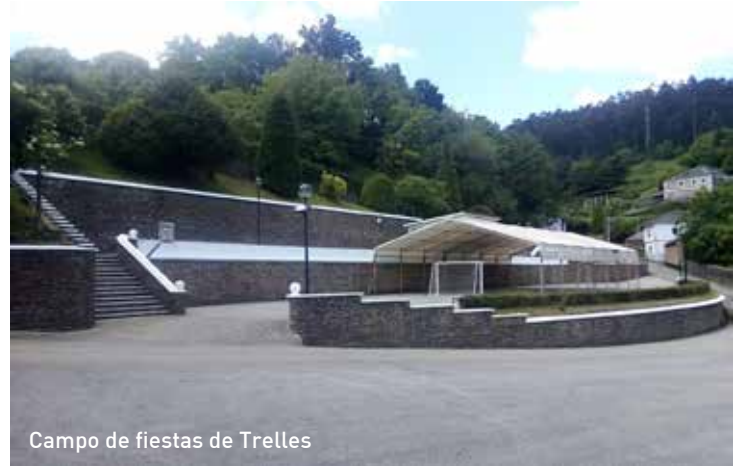
Campo de fiestas de Trelles

A través del personal contratado por el Plan de Empleo Local y con el refuerzo de operarios municipales, se ha procedido a la realización de actuaciones de mantenimiento del campo de fiestas de Trelles, consistentes en: