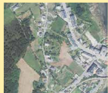
Camino en El Cañón

Asimismo, se incluirá en una segunda fase, la intervención en la plaza situada frente a la Escuela de Música para mejorar sus condiciones de accesibilidad rodada y peatonal, humanizando de este modo el espacio.