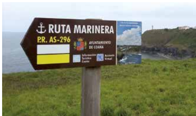
Puesta a punto de las rutas

Es por ello que, desde las Concejalías de Deporte y Turismo, se ha hecho de cara a la época estival una apuesta importante por la promoción de las rutas con que contamos y que pueden ser disfrutadas en familia, con el compromiso firme de: