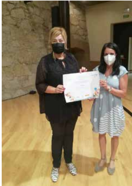
Entrega del título Ciudad Amiga de la Infancia

ca el respaldo de las diferentes concejalías municipales, de diferentes agentes socioeducativos y de la propia infancia, que individualmente o a través de los grupos de participación tiene la oportunidad de protagonizar cambios a favor del desarrollo, a favor de pueblos pensados por y para los niños, a favor del progreso.