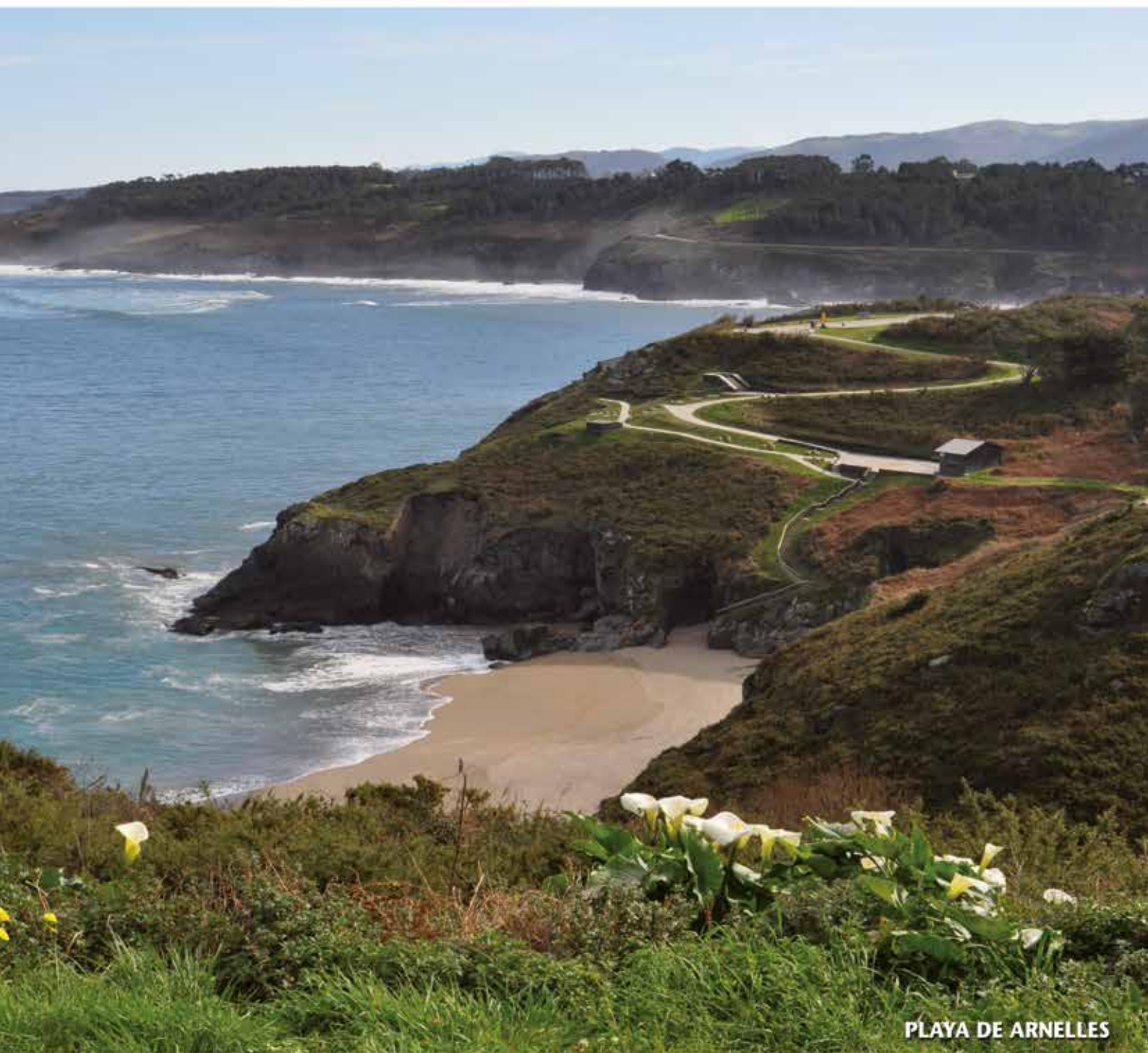
PLAYA DE ARNELLES

REVISTA DE INFORMACIÓN MUNICIPAL • N° 77 • JULIO 2021