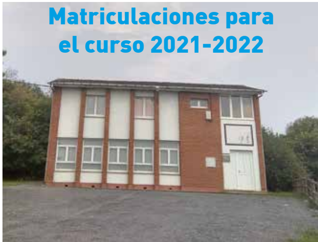
Edificio de la Escuela de Música

En octubre iniciamos un nuevo curso académico para el que abrimos el periodo de matriculaciones en el mes de septiembre, del 9 al 24, ambos inclusive. El horario de atención al público se extenderá desde las 8:00 a las 15:00 horas, de forma presencial en la Biblioteca Municipal "Gonzalo Anes", situada en Ortiguera, o bien vía telefónica a través de los teléfonos 650 46 00 22 y 985 47 34 61.