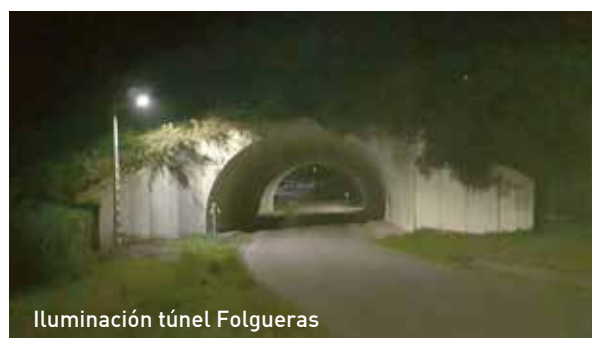
Iluminación túnel Folgueras

De esta forma, otorgamos a dicho tramo la iluminación suficiente para garantizar la seguridad de viandantes y conductores.