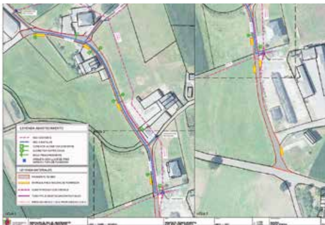
Renovación red de abastecimiento en Loza