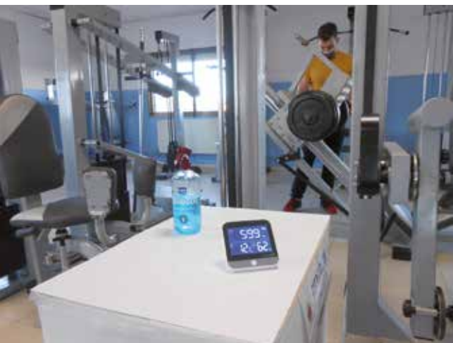
Medidores de CO 2 en el gimnasio

Los padres y madres interesados deben inscribirse a través del Centro de Dinamización Tecnológica Local, las plazas son limitadas y se desarrollarán con todas las medidas sanitarias.