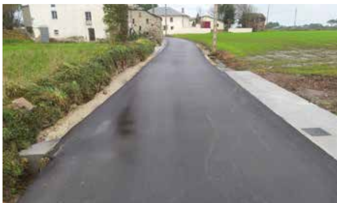
Camino en Loza