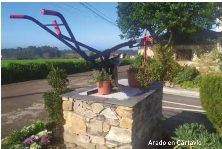
Arado en Cartavio