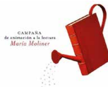
Campaña María Moliner

El premio, 2.014,69 euros posibilitará contar con una colección actualizada que atiende a la demanda creciente de lecturas por diferentes sectores poblacionales.