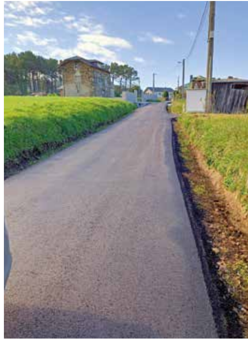
Camino El Esteler a Silvarronda