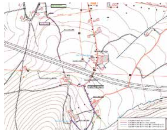
Abastecimiento de agua Silvarronda-Cartavio