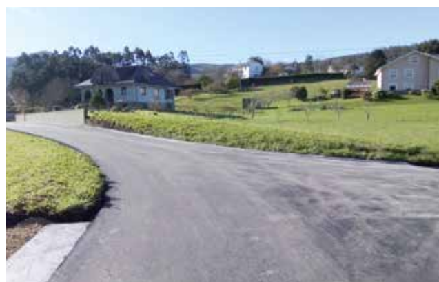
Camino A Roxa en Trelles