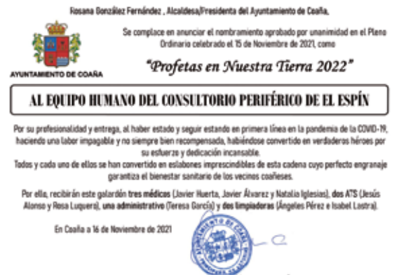
Profeta en Nuestra Tierra 2022

En él, cada uno de los integrantes de la plantilla recibirá el diploma acreditativo y la estatuilla diseñada para este reconocimiento: una reproducción a escala de la escultura del labrador (Cartavio) encargada al artista tapiego Javier Cancio.