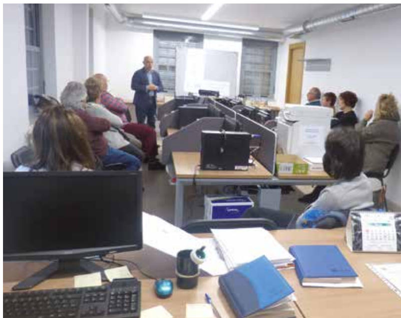
Centro de Dinamización Tecnológica en Coaña