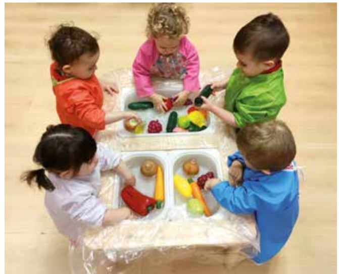
Escuela de Educación Infantil "La Estela"

Abordar desde una perspectiva global la educación para la salud en la escuela como un elemento integrado en el proceso educativo, pretende prevenir y formar simultáneamente.