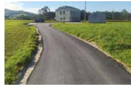
Camino de Lugarnuevo