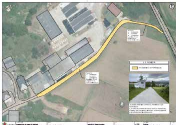
Pavimentación Camino de Santiago

• Intervenciones en el Camino de Santiago: Está prevista la pavimentación mediante hormigón del tramo de Camino de Santiago situado en el fondo de Jarrío en el entorno de la ganadería de casa Eloy, completando así las obras de mejora de otros tramos del Camino de Santiago en Cartavio y Barqueiros realizadas en 2019. Además, por parte de la Consejería fue adjudicado y en próximas fechas se ejecutará el arreglo de un tramo a su paso por Barqueiros.