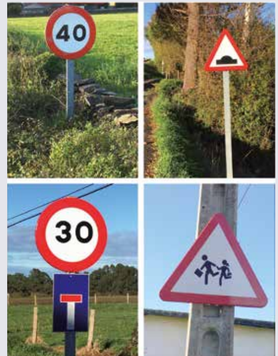
Mejoras en la señalización

Desde la Concejalía de Seguridad Ciudadana, a través del servicio de Policía Local, se permanece alerta en todo momento para detectar posibles carencias en este aspecto que deban ser subsanadas.