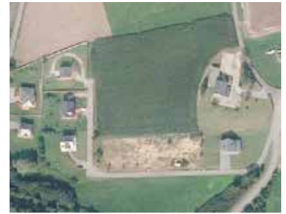
Alumbrado en el Campo de la Feria