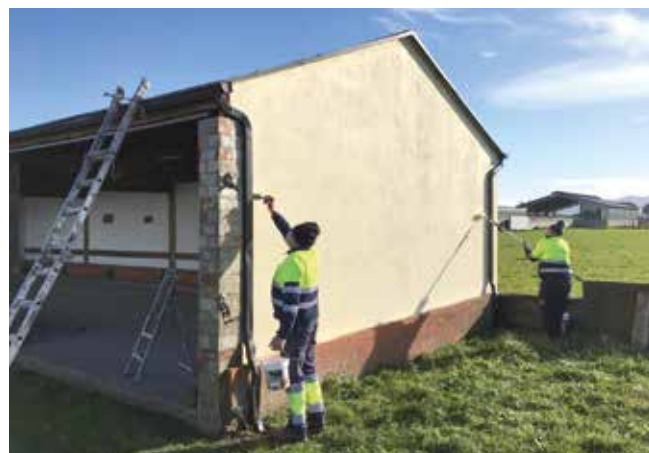
Bolera en Loza

• Carretera de El Cañón (El Espín): Se encuentra en fase de redacción el proyecto para la reparación de este vial que no fue reparado con motivo de las obras acometidas para la estación de bombeo. El proyecto comprenderá dos fases: una destinada al arreglo del vial y otra a la mejora de la parcela de la Escuela de Música, donde se plantea la reordenación y pavimentación de accesos, espacios de aparcamiento, etc.