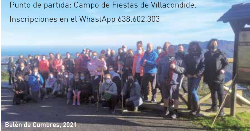
Belén de Cumbres, 2021

Inscripciones en el WhastApp 638.602.303