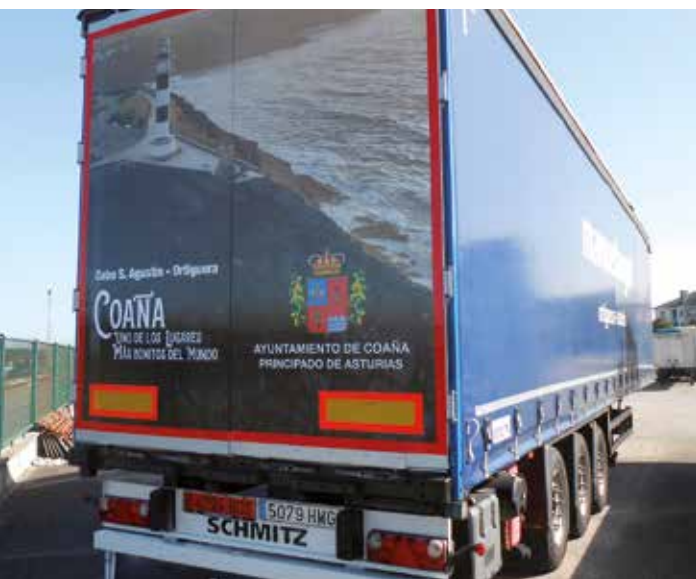
Rotulación de camión

Desde hace unos días, la imagen de uno de los lugares más emblemáticos del concejo, luce en la trasera de un camión dedicado al transporte de mercancías. Este vinilo pretende dar a conocer la belleza de nuestro concejo allá por donde vaya. Agradecemos a su propietario la colaboración para convertirse en soporte publicitario de nuestro concejo con esta original iniciativa que seguro llamará la atención de cuantos se crucen en su camino.