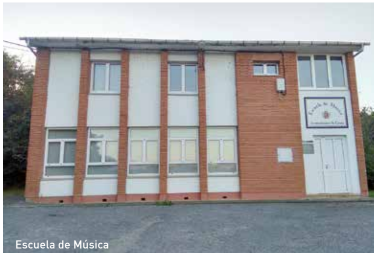
Escuela de Música

Tras 25 años seguimos y seguiremos apostando por una formación musical adaptada a las capacidades e intereses del alumnado, en la que se da prioridad a la calidad del aprendizaje, a la conservación, recuperación, poten-