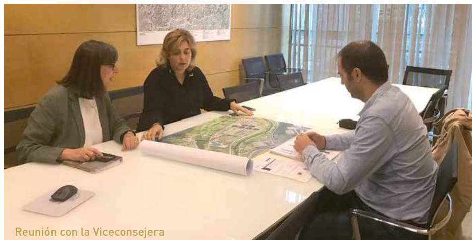
Reunión con la Viceconsejera