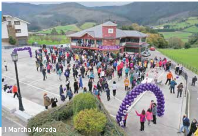
I Marcha Morada