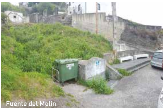
Fuente del Molín

Se prevé abastecer a dicho núcleo mediante su conexión con el depósito de Orbaelle a través de una tubería que tendrá una longitud aproximada de 3,7 kilómetros.