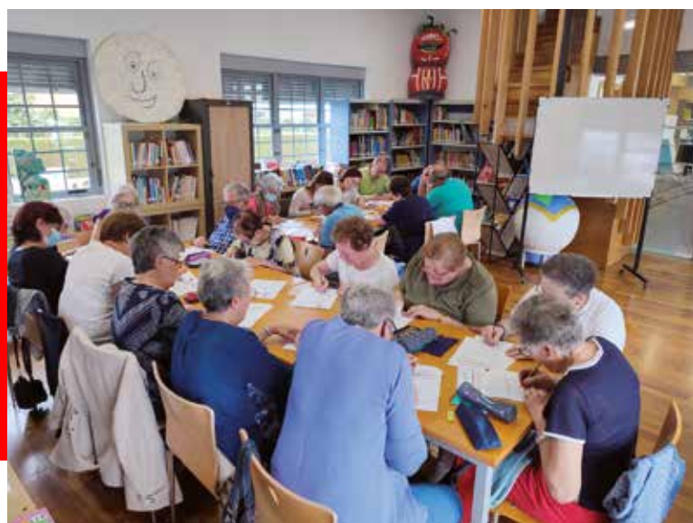
Taller de Memoria

Plazo de inscripciones abierto durante todo el curso.