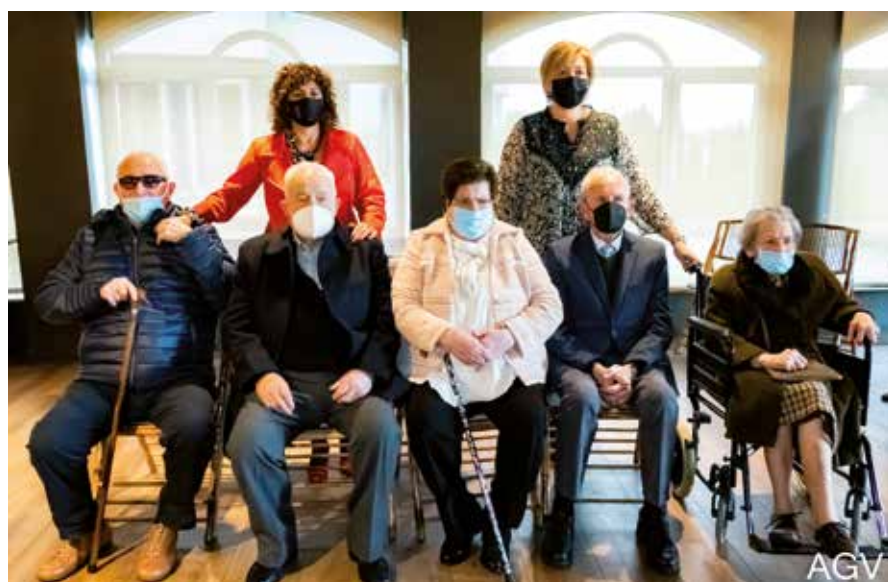
Día de los Mayores