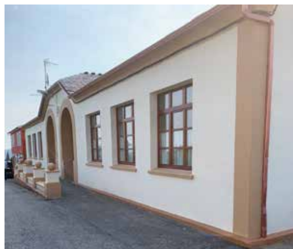
Escuelas de Villacondide

Las principales actuaciones llevadas a cabo en dicho equipamiento han sido el lijado y pintura de la carpintería exterior; pintura de locales interiores; instalación de falso techo en sala de calderas-almacén y la pintura exterior del edificio.