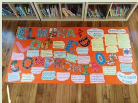
Mural de los compromisos

Con el comienzo del nuevo curso escolar 2022-2023, la Concejalía de Infancia retoma la actividad de los grupos de participación infantil integrados en el Plan de Infancia coañés, con la celebra-