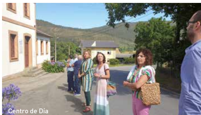
Centro de Día

La Alcaldesa, en una de las entrevistas con la Consejera en el año 2019, ya le había presentado un anteproyecto y aunque ha sido un camino largo, lo más importante es que la Consejera ha cumplido su palabra y COAÑA DISPONDRÁ DE UN CENTRO DE DÍA que mejorará la calidad de vida de nuestros mayores.