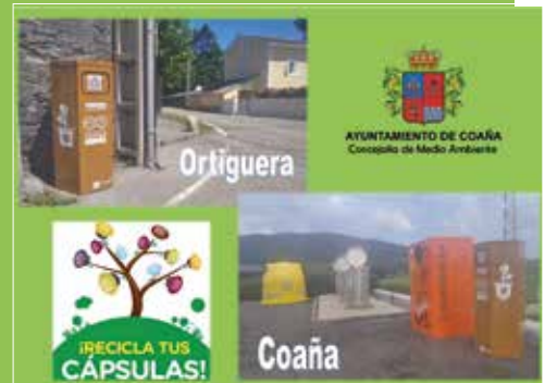
Cartel reciclaje de cápsulas

Seguimos avanzando en nuestra lucha por la conservación del medio ambiente y nuestro compromiso con un reciclaje sostenible. Además se han colocado nuevas baterías de contenedores (vidrio, plástico y cartón) en Torce y el Ribeiro (Ortiguera).