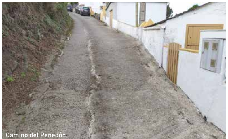
Camino del Penedón

Se pretende la realización de una intervención integral en los tres espacios que incluye: la fuente, la plataforma peatonal y la ladera existente en la zona, con el fin de mejorar el entorno y mantener en perfecto estado un lugar emblemático y de gran valor sentimental para esta zona del pueblo.