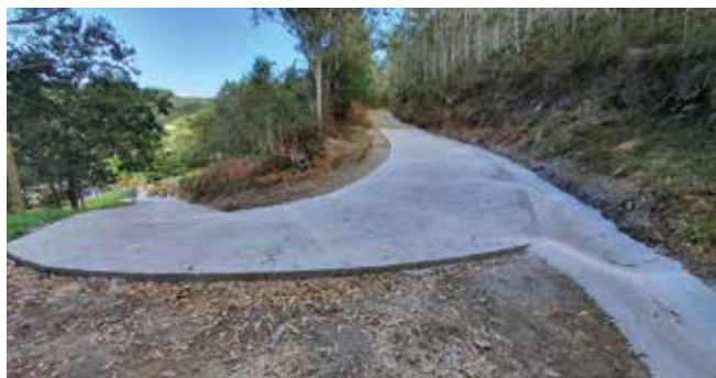
Pavimentación camino de Lebreo