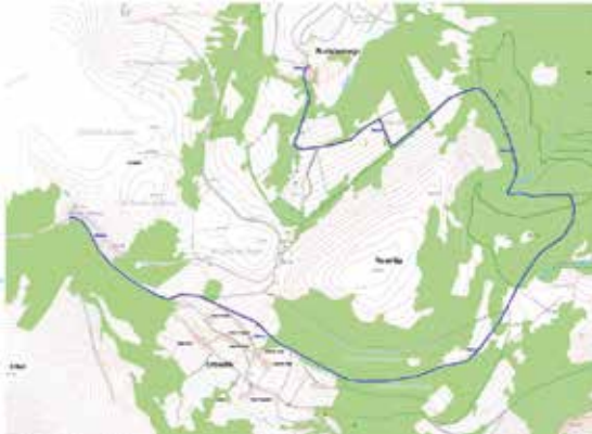
Proyecto traída de agua de Bustabernego