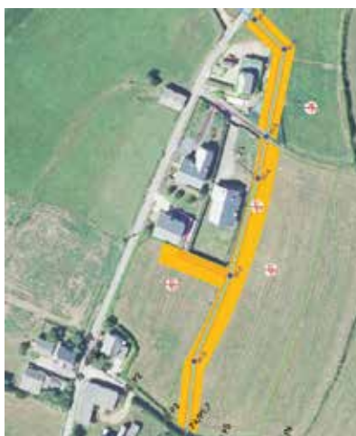
Saneamiento en Foxos

supuesto que el saneamiento de Barqueiros y El Espín se derive o se conecte con la estación de bombeo de El Espín y termine en la EDAR de Navia-Coaña.