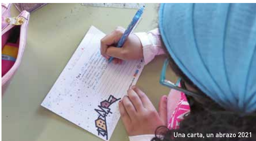
Una carta, un abrazo 2021

con el objetivo de hacer visible las situaciones de soledad que afectan a las personas mayores.