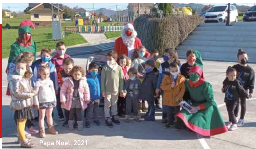
Papa Noel, 2021