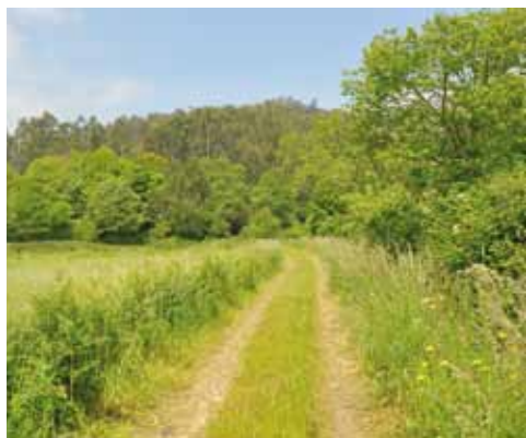
Tramo de la Ruta del Pico Jarrío