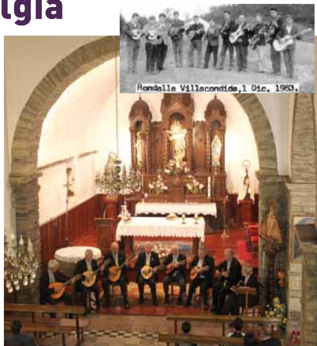
Rondalla Nostalgia, Villacondide

Con tradición y con música, Cultura al calor de un café, acogerá una tertulia- concierto y un merecido homenaje a unos vecinos, protagonistas de una bella historia musical que nace en nuestro concejo, en el pueblo de Villacondide.