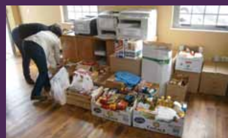
El Alcalde de Coaña con miembros del Banco de Alimentos

El éxito de esta experiencia solidaria ha sido posible gracias a la colaboración de los vecinos de Coaña.