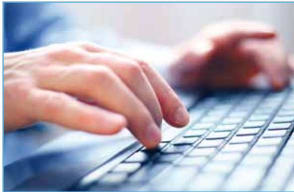
Pie de foto para el artículo

Los destinatarios de este programa son aquellas personas que independientemente de la edad están en proceso de buscar empleo, que quieren conocerse más a sí mismos para optimizar las posibilidades de encontrar