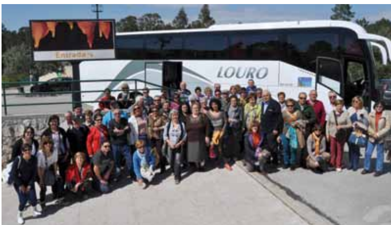
Viaje a Fátima, 2013