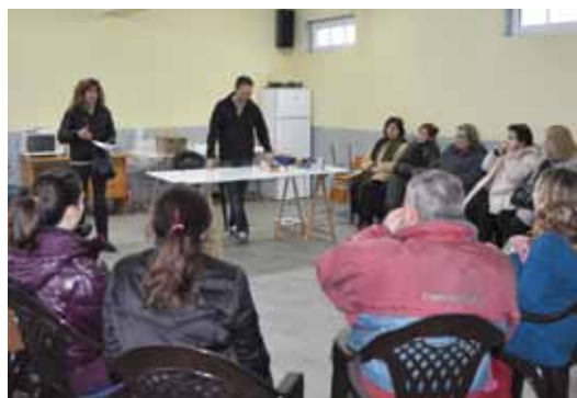
Taller de Electricidad, Escuelas de San Esteban

Detectar pequeñas fugas o averías, descubrir los diferentes tipos de calefacción existentes, la colocación de tomas de antena, el cambio de casquillos, el origen y solución de los principales atascos en fregaderos... son, entre otros, algunos de los temas que se trabajarán en este Taller que organiza la Concejalía de Mujer, Bienestar Social y Movimiento