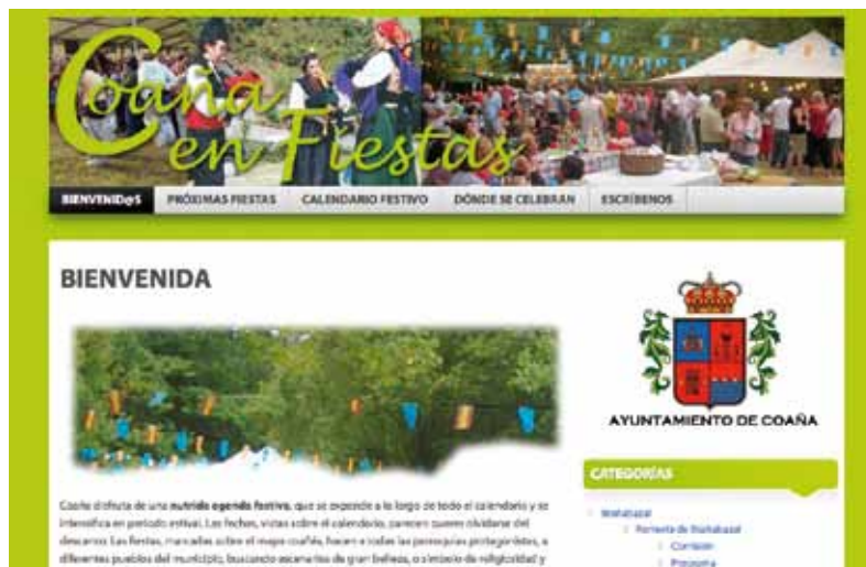
Portada de la web Coaña en Fiestas

Un total de 12 asociaciones y clubes deportivos del concejo han decidido crear y publicar su página web con el Taller de empleo del Ayuntamiento de Coaña. Las primeras páginas ya están listas y se pueden consultar a través de la web municipal: www.ayuntamientodecoana.com o cada