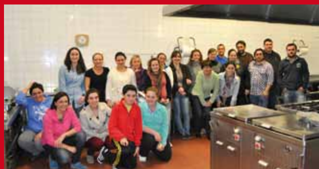
Curso de Cocina celebrado durante este año

El curso tiene un coste de 12 euros por alumno y es necesario inscribirse entre el 21 y el 23 de octubre en el Área de Animación Sociocultural del Ayuntamiento porque las plazas son limitadas.