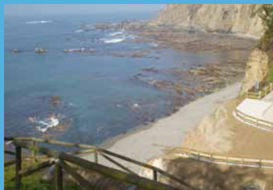
Playa de Torbas

Este servicio estará disponible los fines de semana de julio y agosto, así como festivos, en horario de 12:00 a 19:30 horas.