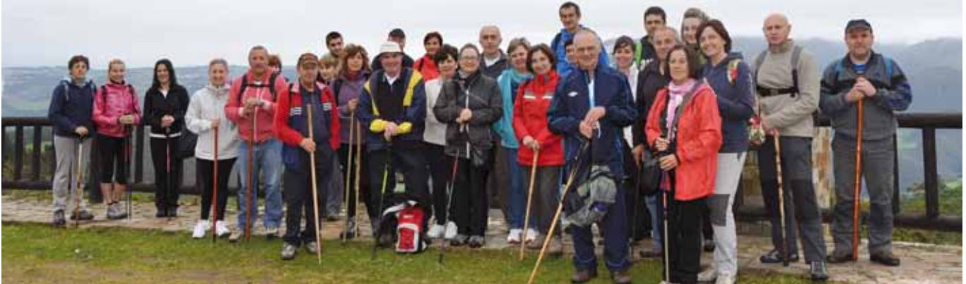
Ruta Cordal de Coaña, junio de 2013

La Concejalía de Deportes del Ayuntamiento de Coaña organiza esta ruta, también llamada las "Foces del Llaímo", que se encuentra dentro de Parque Natural de Redes.