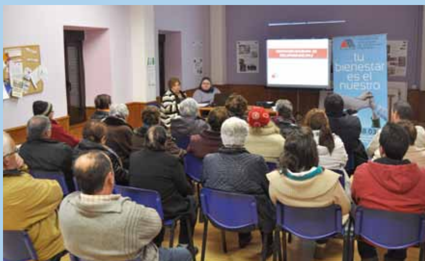
Charla sobre Esclerosis Múltiple.

Jueves 27. 16.30 horas en las Escuelas de Cartavio. "FRATERNIDAD: TODOS DISTINTOS, TODOS IGUALES". Acercamiento a través de profesionales de la Asociación "Fraternidad" ubicada en Tapia de Casariego, al trabajo que éstos desarrollan con personas con discapacidad