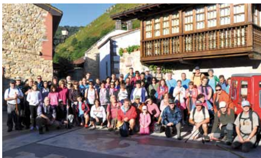
Excursión a la Ruta del Alba. Septiembre 2013.

Cuenta con unos 13 kilómetros de recorrido en los que se visitarán diversas aldeas de alto interés etnográfico como "A Valía", "Ferreira", "As Casías", "San Julián", "Caraduxe" o "Ferreirela"; así como hermosos bosques con vegetación autóctona y gran variedad de especies.