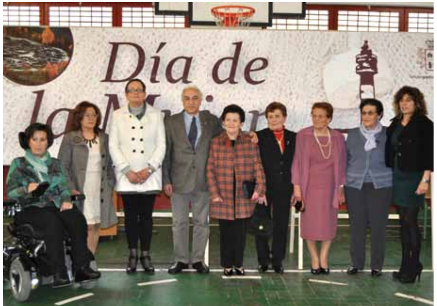
Día de la Mujer 2013.

sábado 8 de Marzo a partir de las seis de la tarde en el propio Colegio y posteriormente se degustará una espicha para la que será necesario adquirir previamente un vale al precio de 5 euros.