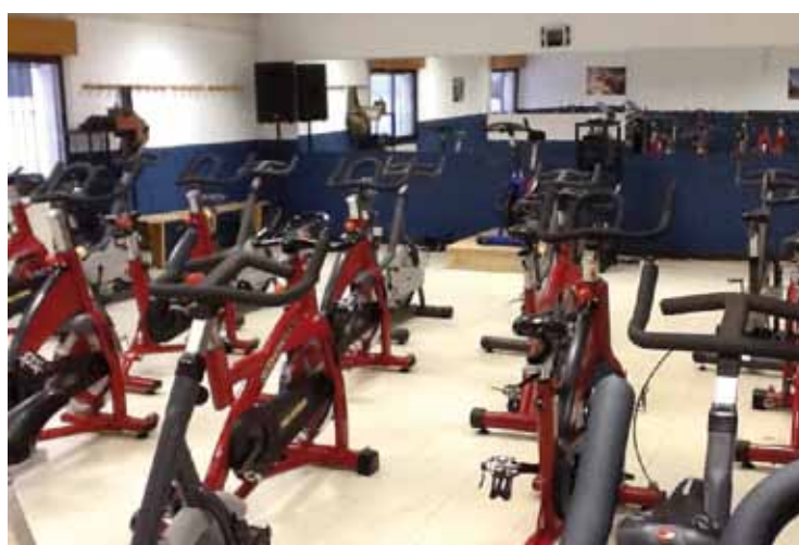
Polideportivo de Jarrío, sala de spinning.