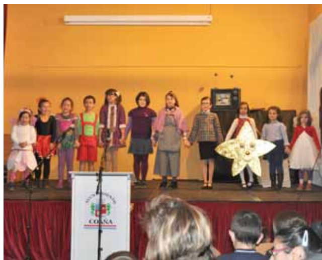
Teatro Literatura de colores en 2013.

Esta campaña engrosará el fondo con 181 nuevos libros y con la suscripción anual a cinco revistas: Scherzo (música), Descubrir el Arte, Historia y Vida, Letras libres (literatura) y Claves de la Razón Práctica (pensamiento político). Además,