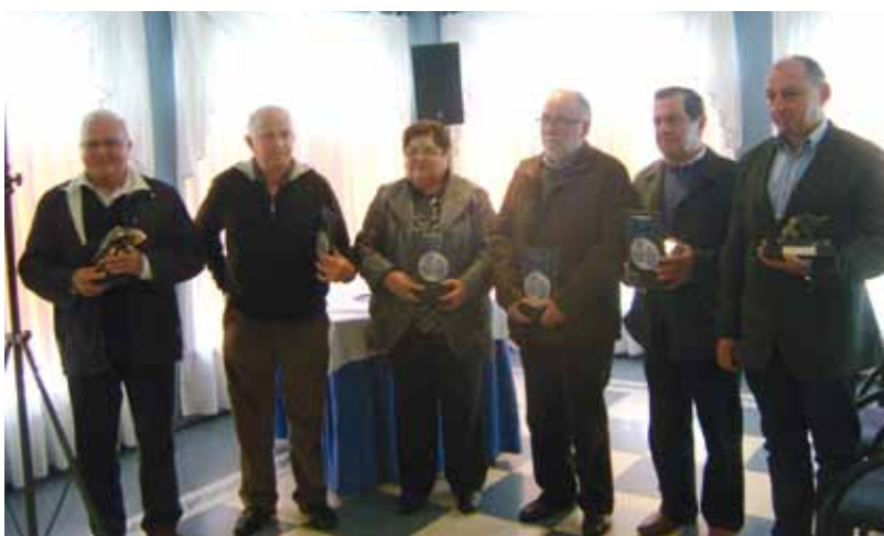
Homenajeados en la edición de 2013 del Día de la caza y la pesca.

reconocer como "Pescador del Año" al coañés que más salmónes haya capturado en los ríos asturianos durante la última temporada y por otra, premiar al "Pescador más joven", reconociendo así su contribución al mantenimiento de uno de los deportes tradicionales de nues-