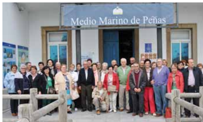
Viaje a Cabo Peñas en junio de 2013.