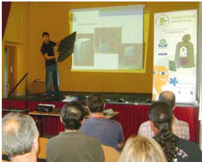
Charla sobre compostaje doméstico impartida por Cogersa el pasado año en Ortiguera.

El Ayuntamiento de Coaña pondrá a disposición de los participantes, como en años anteriores, una biotrituradora, que permite triturar los restos vegetales procedentes de la poda, desbroce y recogida de hojas secas para reutilizarlos en forma de compost o abono orgánico a través de la compostadora.