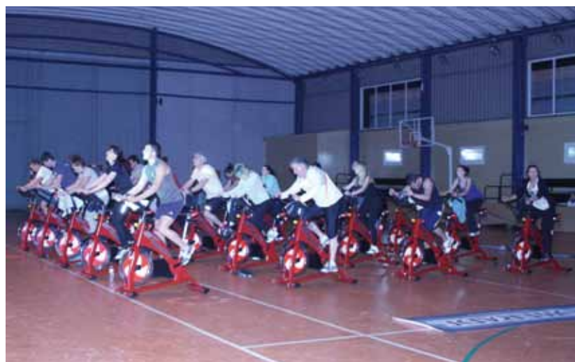
Exhibición de Spinning en el Polideportivo Municipal.

La tasa de actividad con monitor tiene un coste de 23 euros, el mismo que durante el pasado año