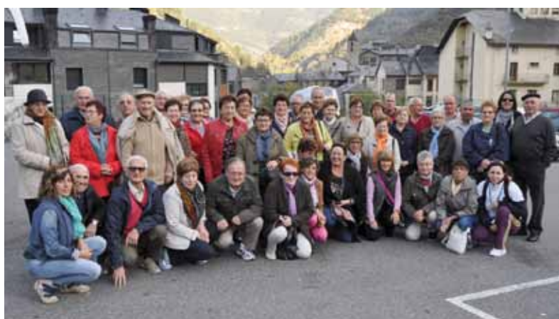
Viaje a Lourdes, realizado en octubre del pasado año.

Las personas interesadas en participar han de inscribirse en el Área de Animación Sociocultural antes del 12 de Febrero, siendo el precio por persona de 22 euros.