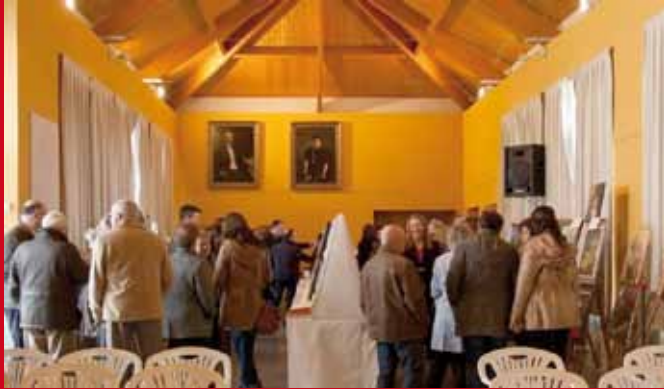
Gala de Artistas de Coaña en 2013.

El proyecto que la Concejalía de Cultura inició hace dos años, llega a su tercera edición con una exposición sobre arte popular. Un proyecto que mantiene en el tiempo su principal objetivo: dar a conocer y dinamizar el arte popular y la cultura de nuestro municipio.