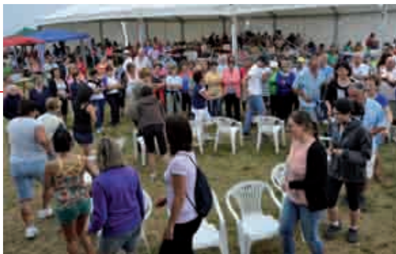
Romería Pico de Jarrio 2014

San Agustín y Ntra. Sra. de La Caridad en Ortiguera: 29, 30 y 31