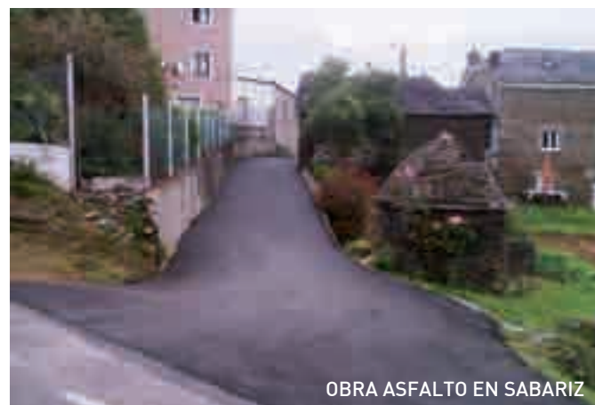
OBRA ASFALTO EN SABARIZ

Eterna reivindicación de este Ayuntamiento, logrando que sea una realidad a través de la Dirección General