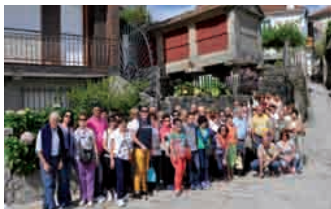
Viaje a las Rías Baixas

se iniciará a las 6.30 de la mañana en la Plaza del Ayuntamiento de Coaña; a las 6.40 en la Parada del Bus de El Espín; 6.50 en la Marquesina del Hospital de Jario; y 7.00 en el Mayce.