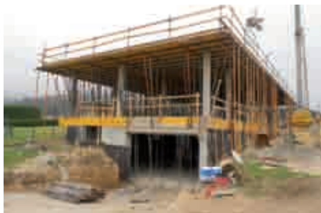
Vivienda en construcción en El Esteler, Cartavio

Si se cumplen los requisitos señalados se devengará una tasa equivalente al 1,5% sobre el presupuesto de ejecu-