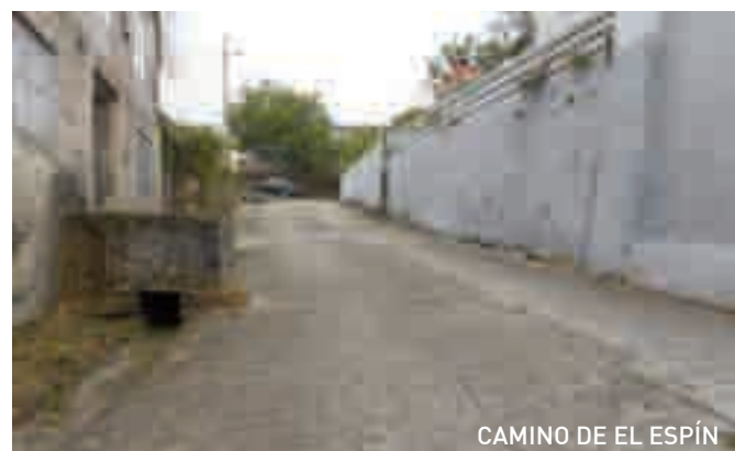
CAMINO DE EL ESPÍN