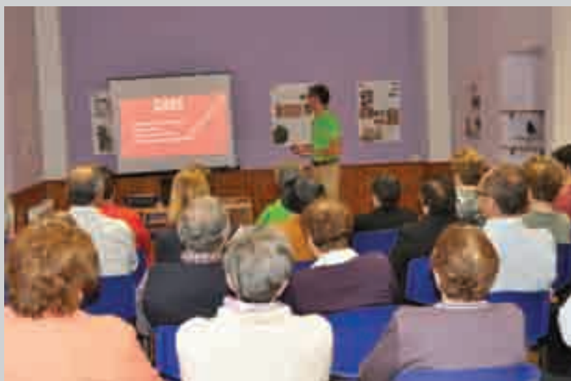
Escuela de Salud. Junio 2014