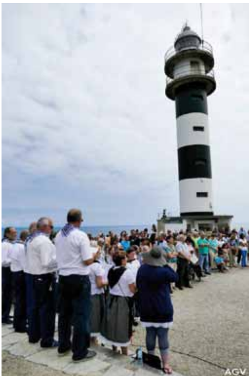
Día del Mar, 2015