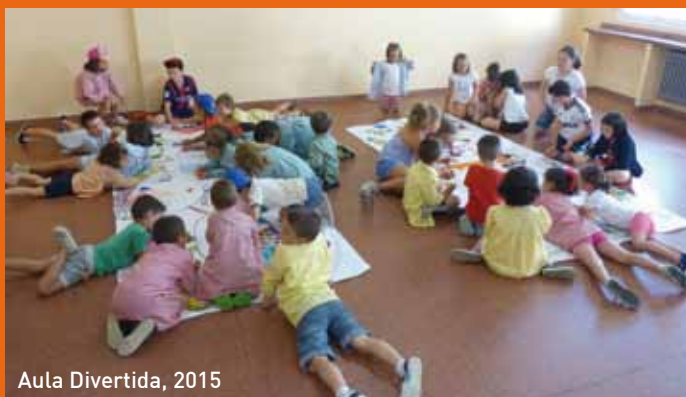
Aula Divertida, 2015