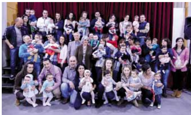
Día del Libro, 2015