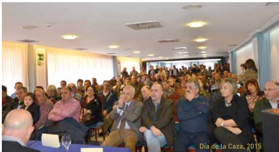
Día de la Caza, 2015

Los actos tendrán lugar en el Restaurante Blanco de La Colorada el sábado 5 de marzo. Las personas que deseen asistir podrán adquirir el correspondiente vale en el Ayuntamiento o a través de los miembros de la Junta Directiva de la Sociedad de Cazadores "El Corzo", hasta el viernes 26 de febrero.