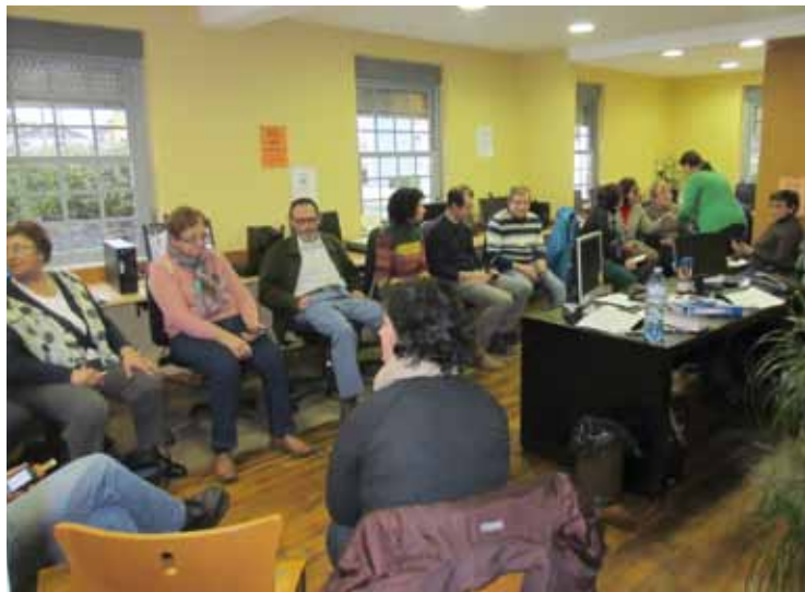
Actividad de uno de los talleres en el CDTL de Coaña