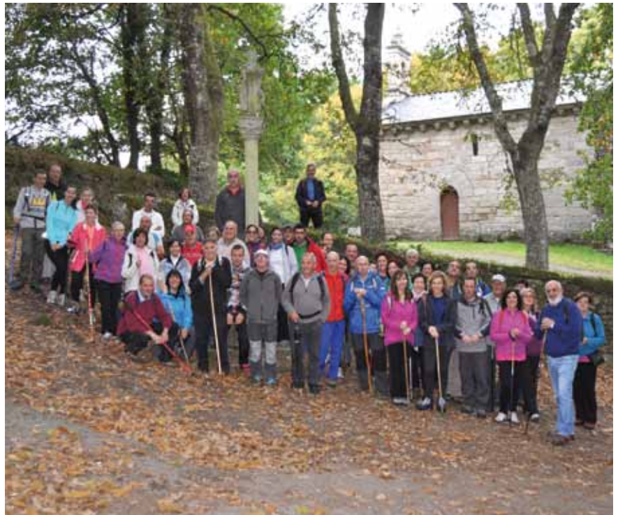
Ruta del Agua Guitiriz, 2015

Inscripciones: Hasta el 5 de Abril en el Área de Animación del Ayuntamiento de Coaña (985.473.535, extensión 3)