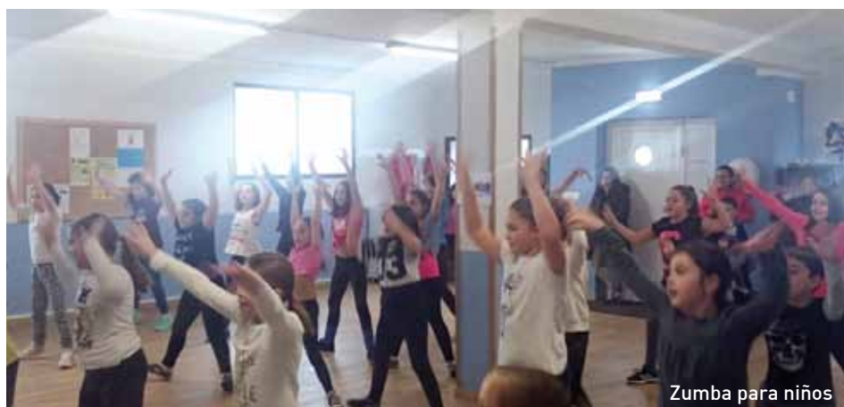
Zumba para niños

El 22 de octubre el Pleno de la Corporación en sesión ordinaria aprobó la modificación parcial de la ordenanza reguladora de las instalaciones deportivas municipales, modificando concretamente el artículo 5 "Cuotas tributarias".