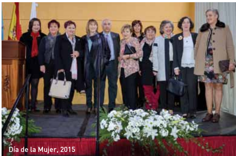
Día de la Mujer, 2015

Los actos tendrán lugar el sábado 12 de Marzo a las 12.30 horas en la Casa de Cultura Municipal (Ortiguera). El programa completo de esta celebración se publicará en fechas próximas.