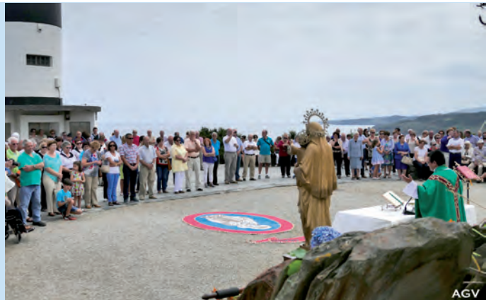
Misa y ofrenda en Ortiguera 2015

Un año más, Ortiguera será el escenario perfecto donde rendir homenaje a todas las personas que han dedicado su vida al mar.