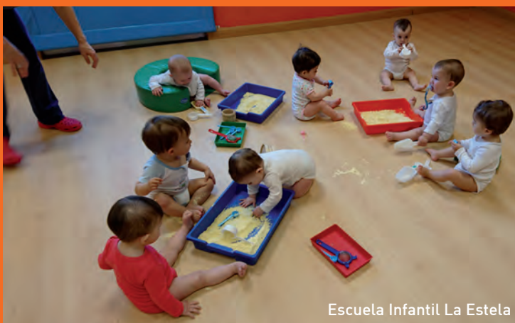
Escuela Infantil La Estela

Y como todo no puede ser trabajar, a lo largo de estos meses, también celebramos días especiales como el Magosto, el Día de los Derechos de la Infancia, el día de la Paz, la fiesta de Carnaval y con la llegada de la primavera recibimos la visita de una "xatina" a la Escuela.