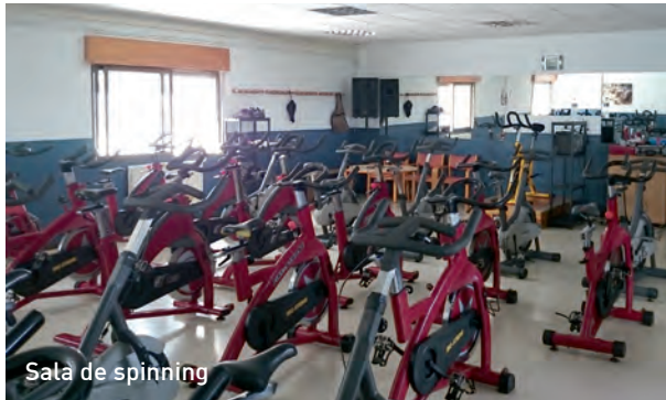
Sala de spinning