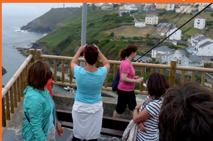
Ruta Marinera 2015

Las fechas en las que se realizarán son: