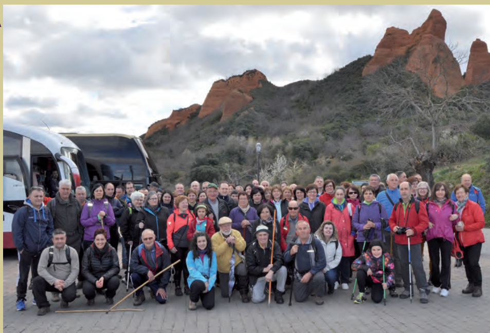
Ruta Las Médulas

Para los días 11 y 12 de Junio, está previsto desarrollar desde la Concejalía de Deportes del Ayuntamiento de Coaña un viaje que nos llevará a descubrir la belleza del Parque Natural de Somiedo, donde realizaremos dos rutas. El coste de este fin de semana, así como todos los detalles organizativos del mismo, se darán a conocer en fechas próximas, por los medios habituales.