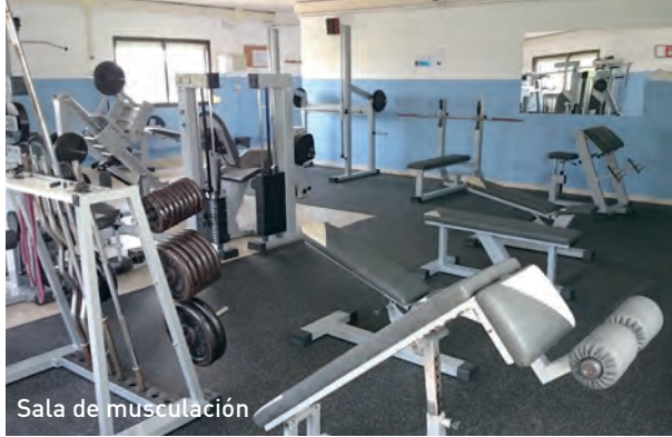
Sala de musculación

LOS DÍAS 7 Y 29 TENDRÁN LUGAR DOS MARATONES SOLIDARIOS