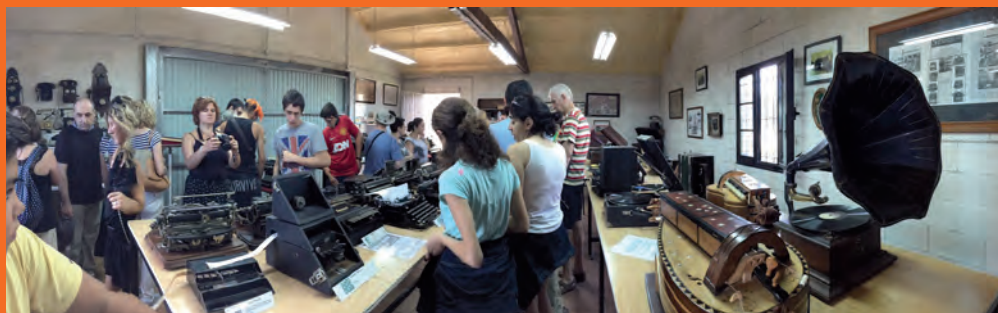
Ruta Etnográfica 2015