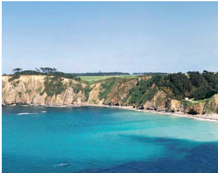
Playa de Torbas