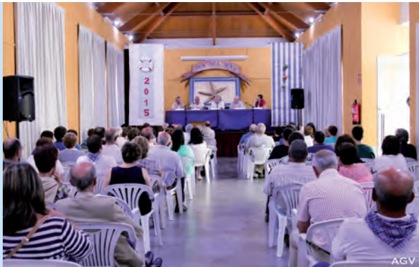
Día del Mar, Ortiguera 2015