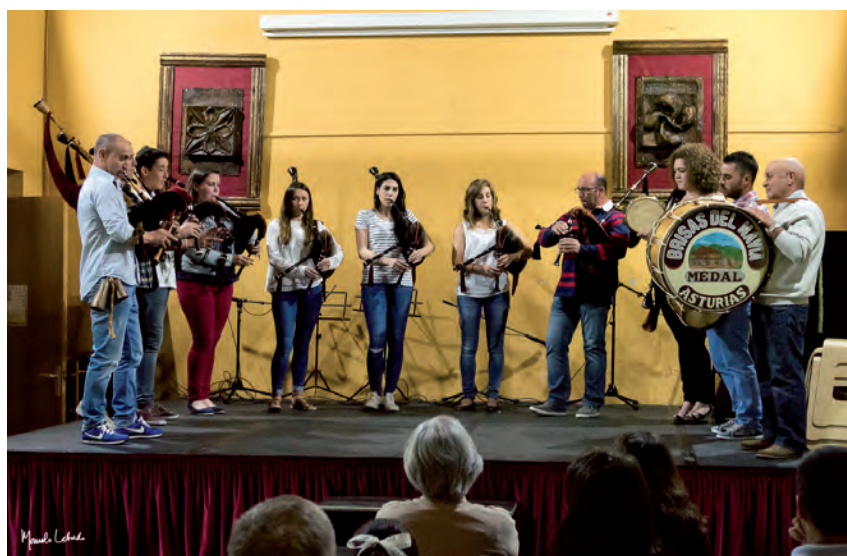
Festival Escuela de Música, 2015

dentro del ciclo de conciertos de Conceyo de Cantares 2016 en colaboración con el Parque Histórico del Navia.