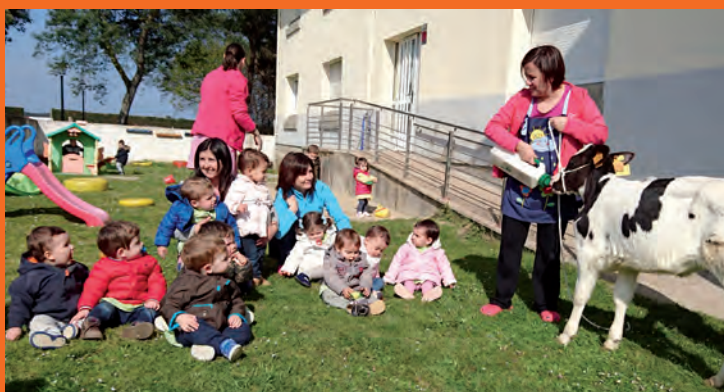
Escuela Infantil La Estela, en contacto con la naturaleza

Desde el pasado 4 de abril está abierto el plazo de preinscripción para el Curso 2016-2017 en la Escuela de educación Infantil La Estela. Más información en la web: www.ayuntamientodecoana.com/