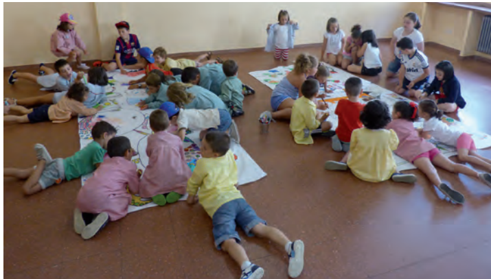
Aula Divertida 2015