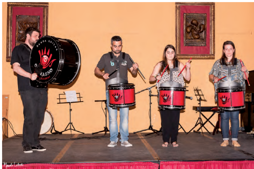
Festival Escuela de Música, 2015

Su repertorio versa sobre piezas musicales recopiladas de antiguos músicos de occidente, junto con canciones tradicionales del Navia-Eo. Esta actuación se enmarca