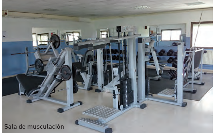
Sala de musculación