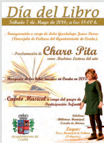
Cartel Día del Libro 2016